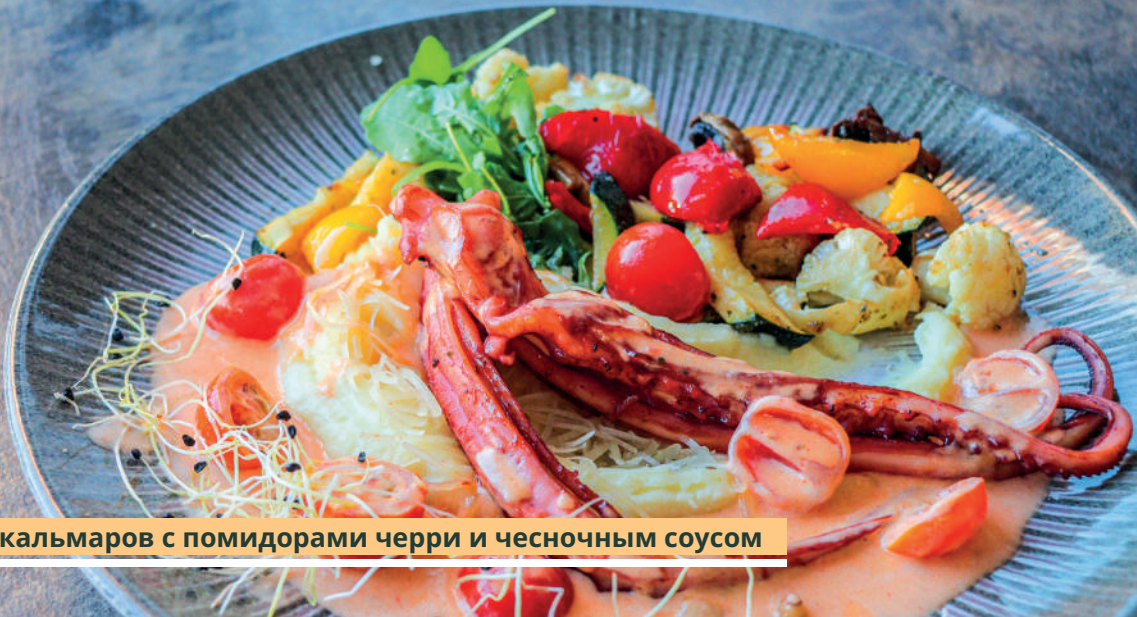
Щупальца кальмаров с помидорами черри и чесночным соусом