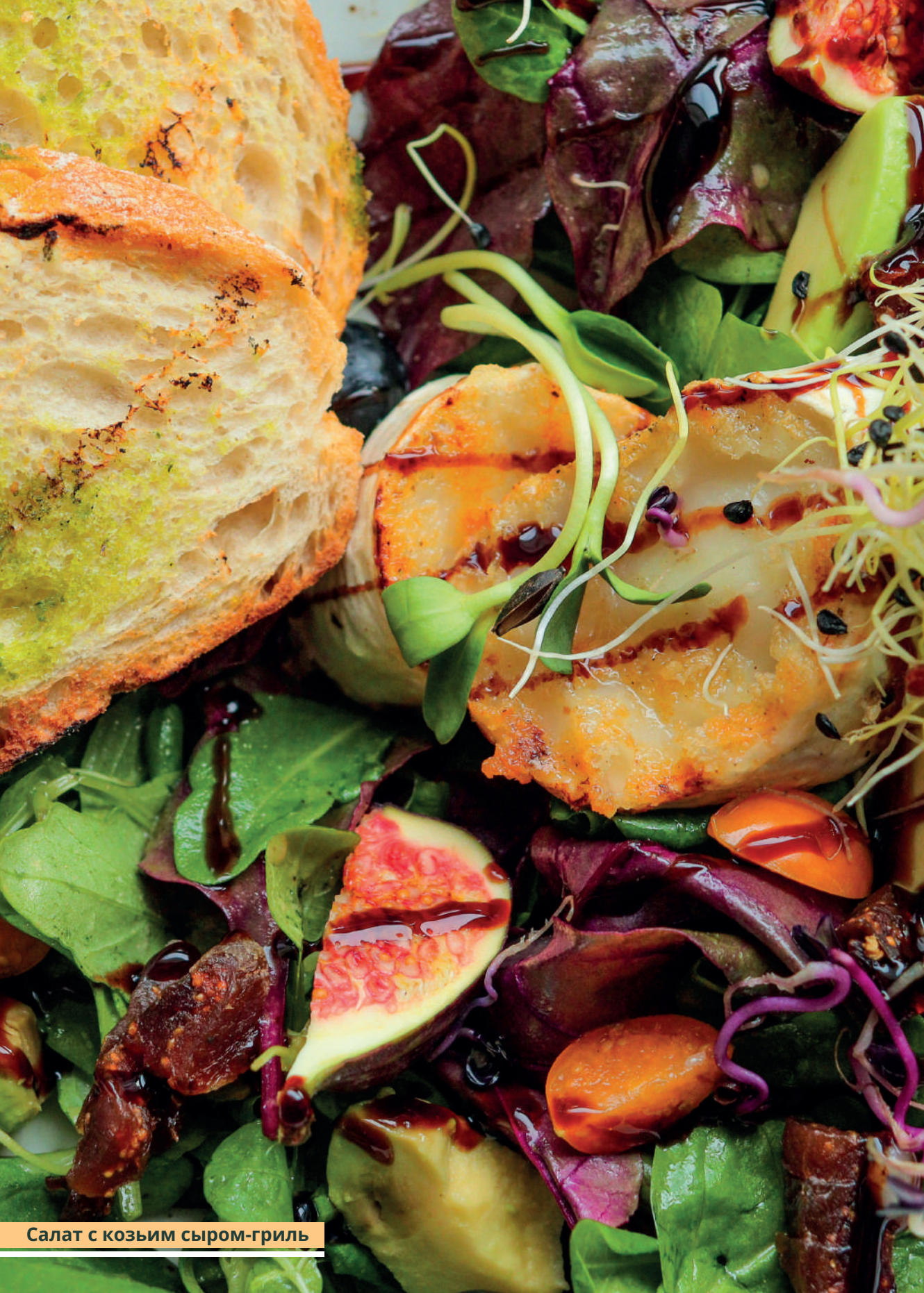
Салат с козьим сыром-гриль