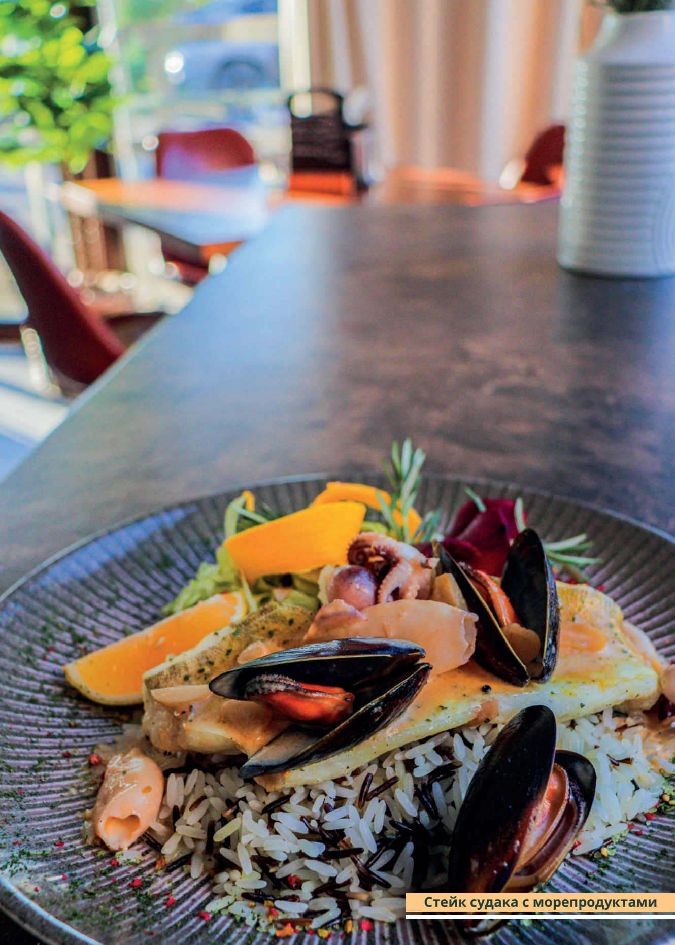
Стейк судака с морепродуктами