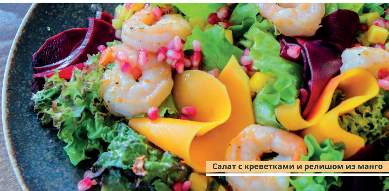
Салат с креветками и релишом из манго