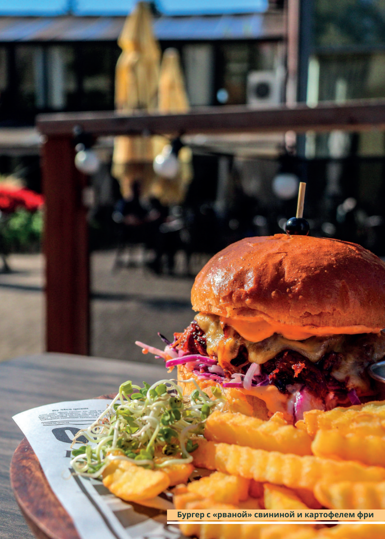
Бургер с «рваной» свининой и картофелем фри